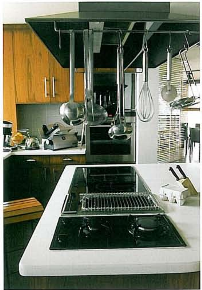
1/ Remarquable par sa structure graphique, l'escalier s'assemble aux piliers en pierre rouge de l'Esterel. 2/ À l'étage, le bureau en acier, verre et corten répond à la forme arrondie de la cheminée. À l'agencement simple et fonctionnel, la cuisine porte également la signature de l'architecte.

aux courbes tendues du bandeau continu de l'avancée de la toiture, qui se déroule comme un ruban suspendu. Au loin se dessine la baie de Cannes avec ses îles. Cet endroit exceptionnel est réservé aux espaces communs déployés sur différents niveaux reliés entre eux, les deux autres ailes de cette demeure étant réservées à la vie privée. L'espace à vivre se module suivant les différents moments de la journée. Les pièces sont continuellement inondées de lumière jouant à travers les stores aux larges lamelles de bois. Pour souligner la continuité et amplifier l'espace vers l'extérieur, le sol est recouvert de teck africain traité qui se prolonge, à l'état brut, sur les terrasses enveloppant la piscine. Le mobilier du séjour et de la salle à manger soutient les grandes lignes du parti pris architectural. En effet, Luc Svetchine considère comme indispensable de créer les éléments de base qui composeront l'ameublement, afin de garder l'harmonie dans son ensemble. Comme dans la partie réservée à la salle à manger, où la table en verre transparent occupe l'espace avec une extrême discrétion et comme dans la cuisine où le mobilier fixe s'inscrit parfaitement dans l'espace de forme circulaire. Dans le séjour, toujours faisant partie du mobilier fixe, le canapé fait face à la cheminée incrustée dans la pierre, tout en s'ouvrant vers la baie vitrée qui court tout le long